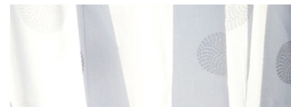
Cortinas incluidas 7 Blancas