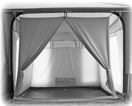
Interior anexo opcional